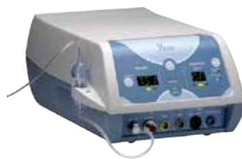
Evolution 3E コントロールユニット

医療機器認証番号: 222AFBZX00087000 医療機器届出番号: 13B1X00229000046