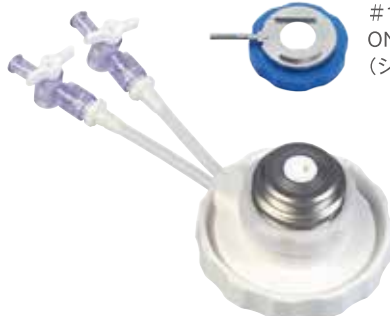
#19187 ONE 人工前房装置用リング (シングルユース)